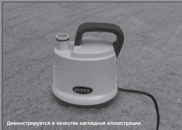
Демонстрируется в качестве наглядной иллюстрации.

Не забудьте о других отличных товарах компании Intex: бассейнах, аксессуарах для бассейнов, надувных бассейнах и домашних игрушках, надувных кроватях и лодках, которые можно найти в крупных магазинах или на нашем веб-сайте. В связи с установкой компании на постоянное усовершенствование изделий, Интекс сохраняет за собой право изменять технические характеристики и внешний вид, в результате чего инструкция будет изменена без уведомления.